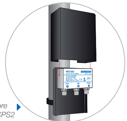
Contenitore da palo CPS2